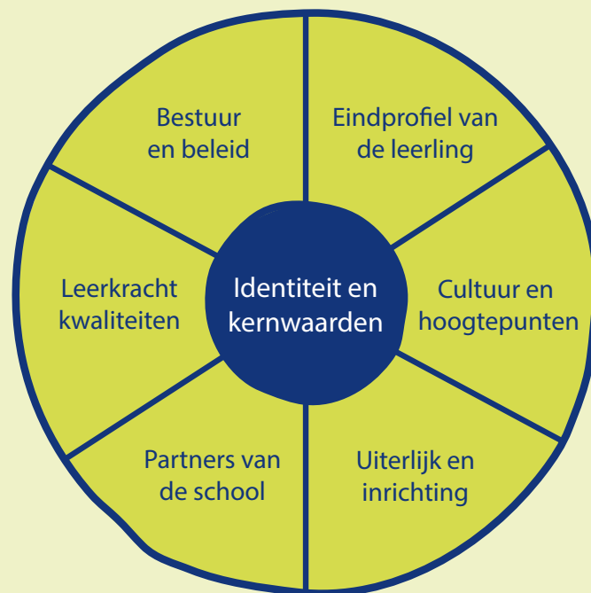
Schijf van zes: identiteit in de praktijk.

Deze richtlijnen zijn enerzijds sturend, en geven een duidelijke ondergrens aan over de uitingvorm van de identiteit. Anderzijds geven ze voldoende ruimte voor verdere invulling van iedere school.